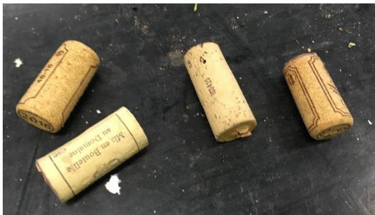
photo 4 : bouchons en liège = borne dans certains supermarchés ou ordures ménagères